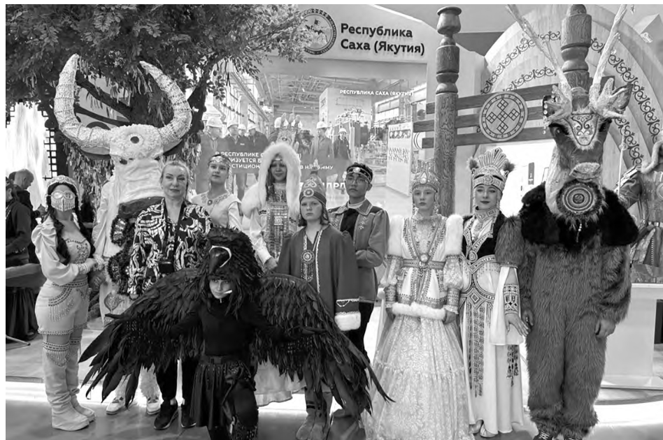
В Москву в этот раз ребята привезли театр стилизованных костюмов героев якутских сказок, легенд, мифов.