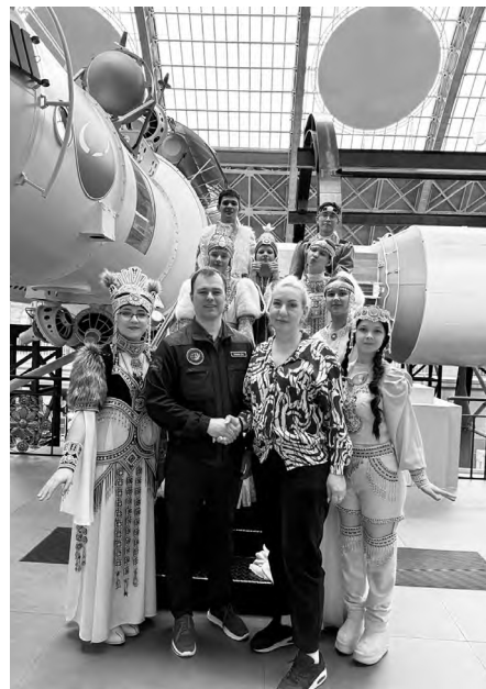
Участники движения «Мы вместе» с Героем Российской Федерации Дмитрием Петелиным

У космонавтов существует традиция брать с собой на МКС мягкие игрушки-талисманы, которые служат индикатором невесомости, когда корабль выходит на орбиту, и когда гравитация перестает действовать, игрушка начинает парить в невесомости. Поэтому девчонки и мальчишки решили также подарить Дмитрию Петелину нашу легендарную лисичку, точно такую же, какую подарили Вя-