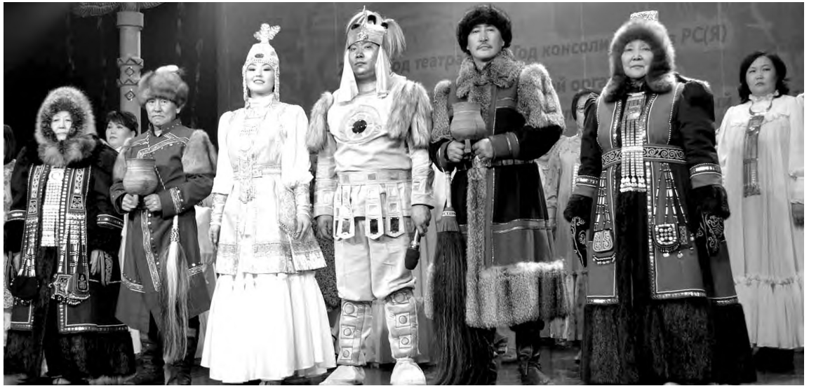
Олонхо «Кулан Кыртай бухатыр»