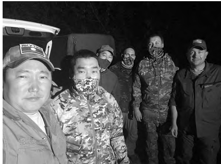
📍 Курские парни

Еще одна из примет новых территорий – гул винтов над головой. Видим, как утром над полями идут три вертолета. Два «аллигатора» Ка-52 сопровождают куда-то трудягу Ми-17. В лучах солнца силуэты «вертушек» черные.