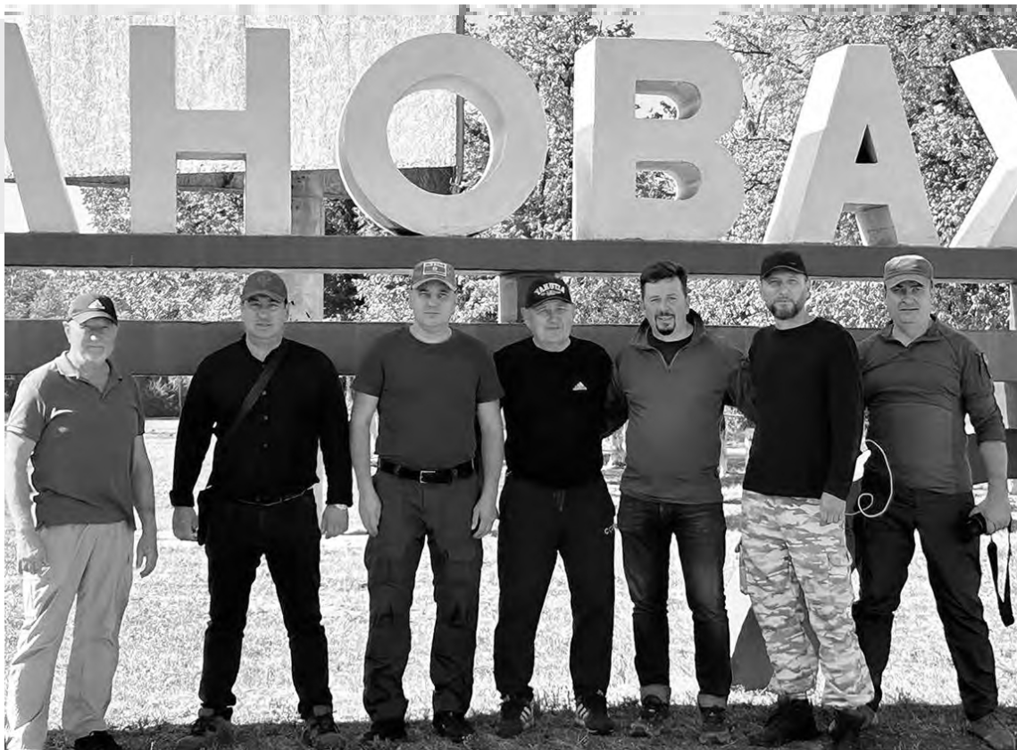
📍 Въезд в Волновуху – отличное место для встреч

«Есть тут якуты, – уверенно вел свою линию полицейский. – Как минимум, один... похож».