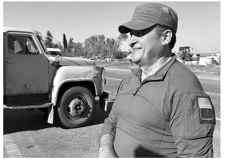
● Дороги на освобожденных территориях строятся и ремонтируются в постоянном режиме

Говорят, что где-то уже запустили ветку ж/д, ну и автодороги приводят в порядок. Срезают фрезой верх старого асфальта, а потом кладут новое покрытие какой-то совершенно неимверной толщиной! Большая часть дороги в оранжевой (временной) разметке. Техника ходит любая – от современных образцов до самосвалов времен СССР. Поля этим летом не пустовали, все чем-то были засажены. С одной стороны трассы они убраны, и лишь возвышаются среди черной земли незапаханные бугры древних курганов. Их тут многие