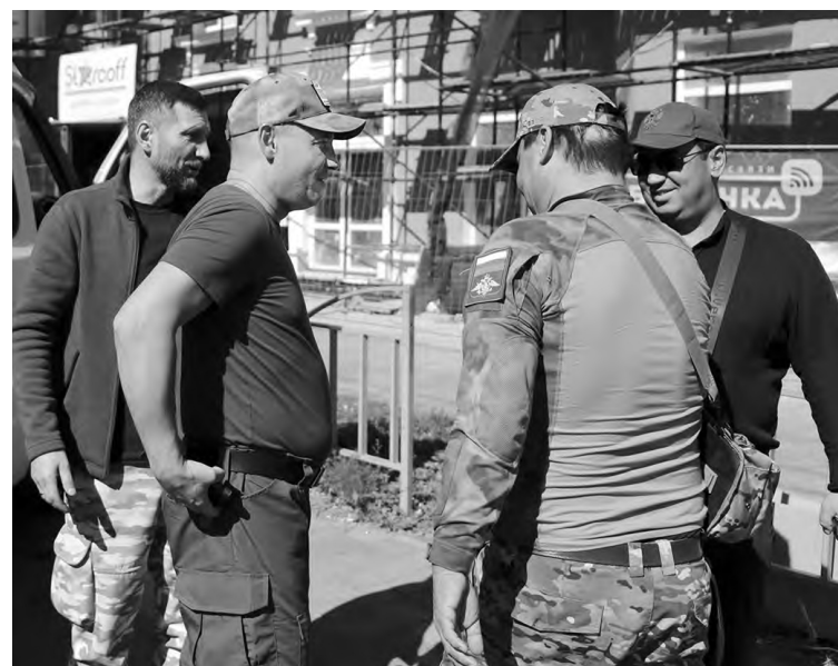
📍 Здравствуй, «Учитель»

Под Волновахой к нам приезжает и... «Танцор», посылку которому мы оставили на опорном пункте. Он получает еще один груз, потом находит в ведомости