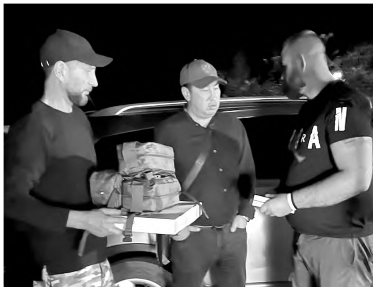
● Часть встреч происходит ночью

тысячи. Люди веками селятся в одних и тех же местах. Часто на границах сел угадываются остатки каких-то валов, фундаментов. С другой стороны дороги стеной стоит подсолнечник. Много посеяно кукурузы, говорят, эта – на семена. Про посадки мне поясняет парень из разведки, с которым едем в соседний населенный пункт. «До войны я сельским хозяйством вовсе не интересовался. А тут все окрестности в полях. Вот информация и накапливается», – рассказывает работник горного производства, отправленный на войну. Таких наших здесь большинство.