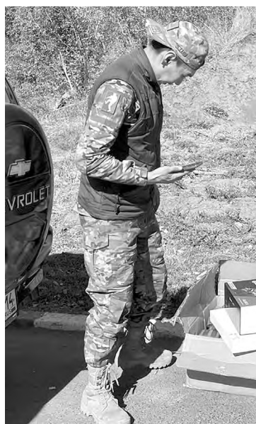
📍 Посылка доставлена под Курск

Пока «Бурят» грузит коробки и расписывается в получении, к нам подходят местные жители. Военных они совершенно не опасаются и, безошибочно опознав в майоре старшего офицера, спра-