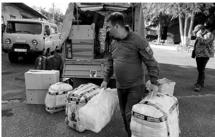
📍 Оставляем посылку «ангелов» в республиканском опорном пункте