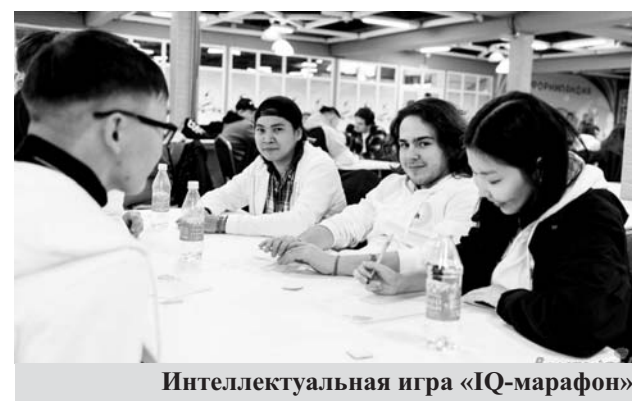
Интеллектуальная игра «IQ-марафон»

Ну а дальше – четыре дня общения, интересных встреч, захватывающих конкурсов и выступлений!