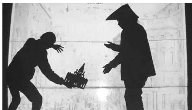
Репетируем театр теней «Люди, меняющие мир»

Театр теней на тему «Люди, меняющие мир» стал для нас настоящим испытанием. Ни у кого прежде не было подобного опыта. Тем не менее, мы поставили номер, посвященный Петру I. Все его заслуги уместили в две минуты. Коронация, Великое посольство, окно в Европу, строительство Санкт-Петербурга – все это было в нашем «силуэтном» выступлении.