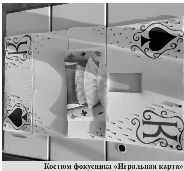
Костюм фокусника «Игральная карта»

На конкурс грима и костюма «Цирк! Цирк! Цирк!» наша задача была продумать костюм фокусника в виде игровой карты. Весь костюм и каркас мы создавали с нуля. Особенностью карты была зеркальная сторона, на которой внизу располагался планшет. На нем показывалось заранее записанное лицо фокусника.